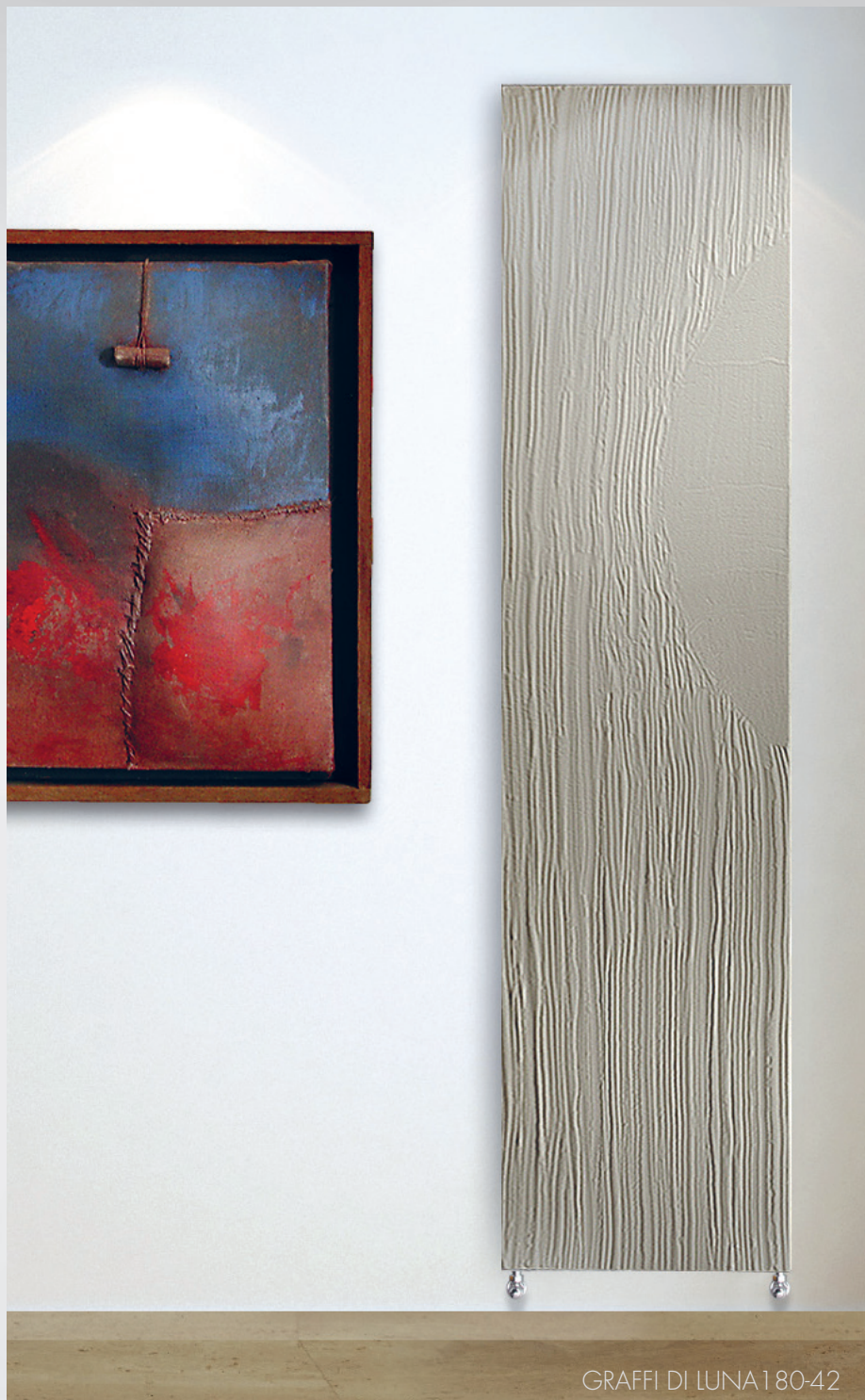
GRAFFI DI LUNA 180-42