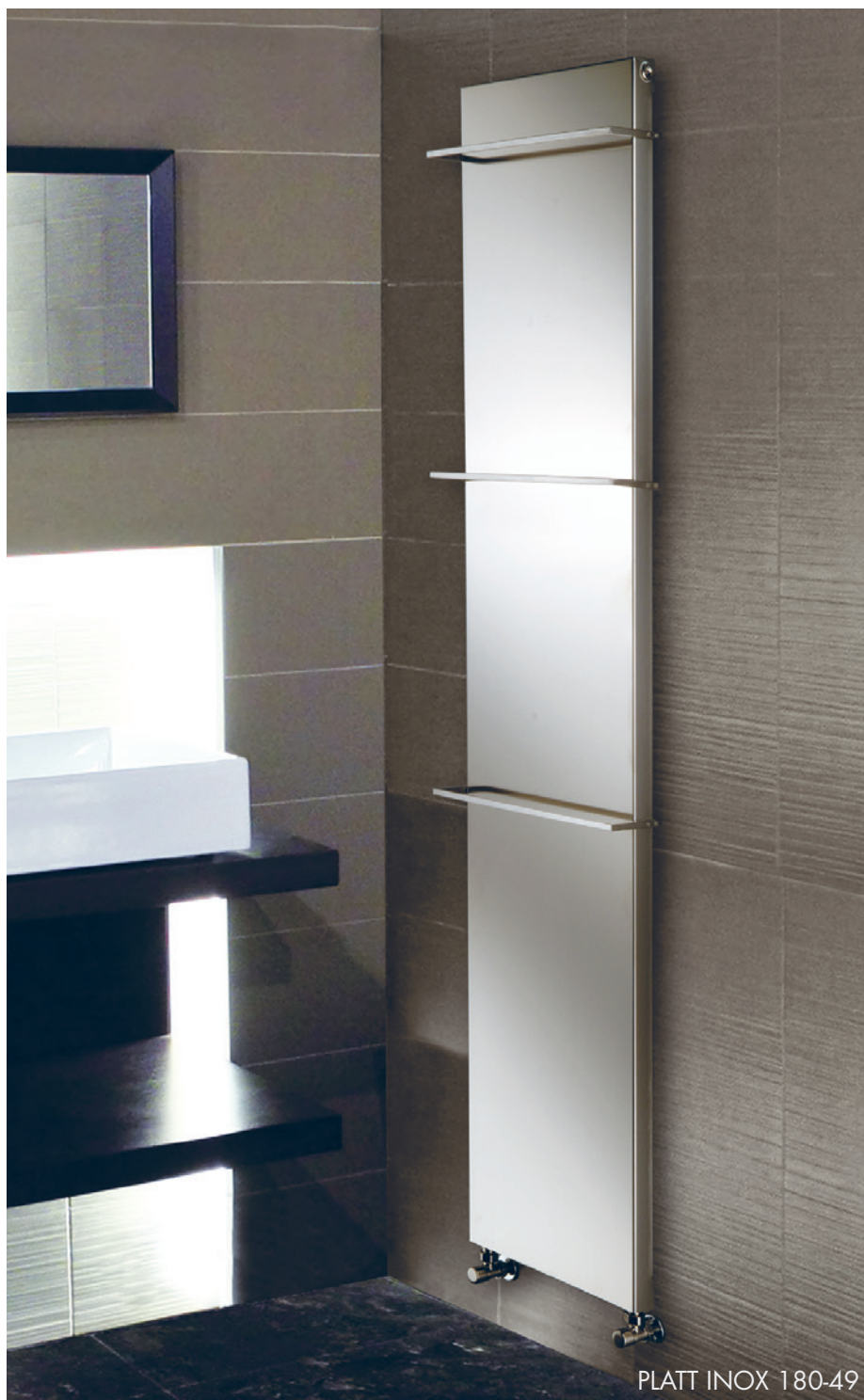
PLATT INOX 180-49