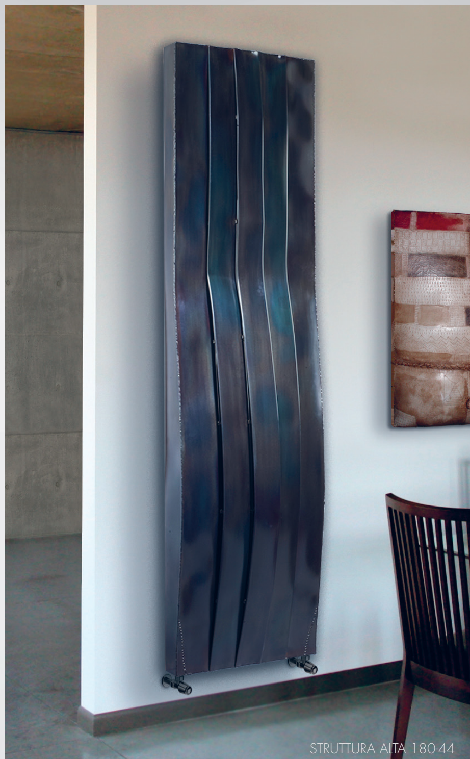
STRUTTURA ALTA 180-44