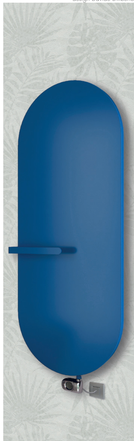
POSIZIONE RESISTENZA © Resistenza verticale