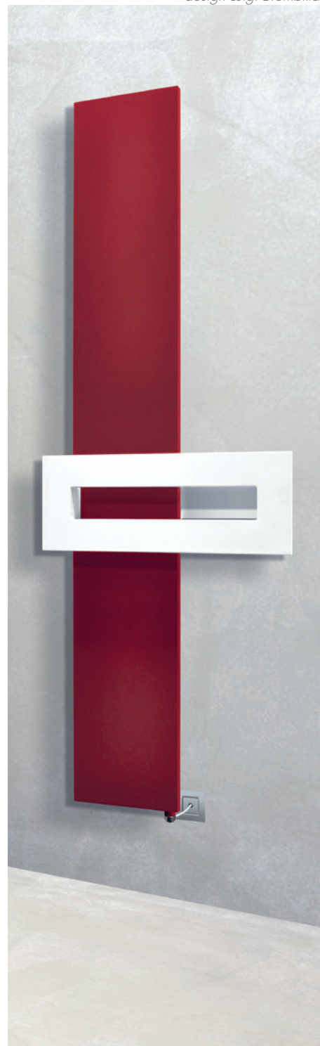
POSIZIONE RESISTENZA