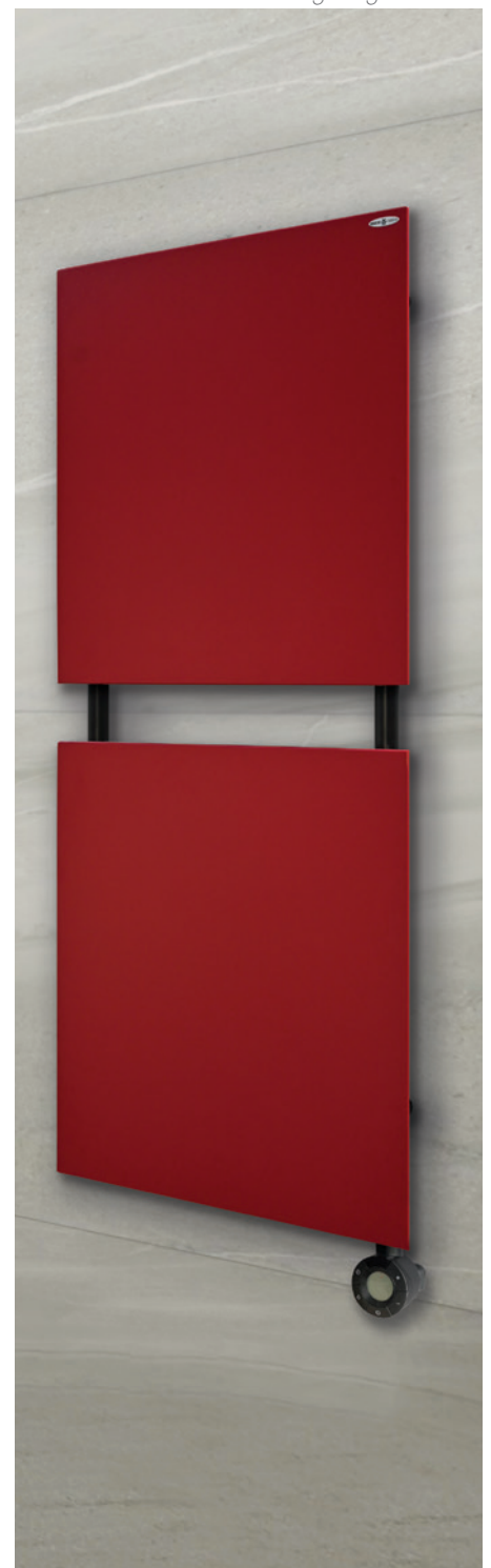
POSITION RESISTANCE ⊗ Résistance verticale