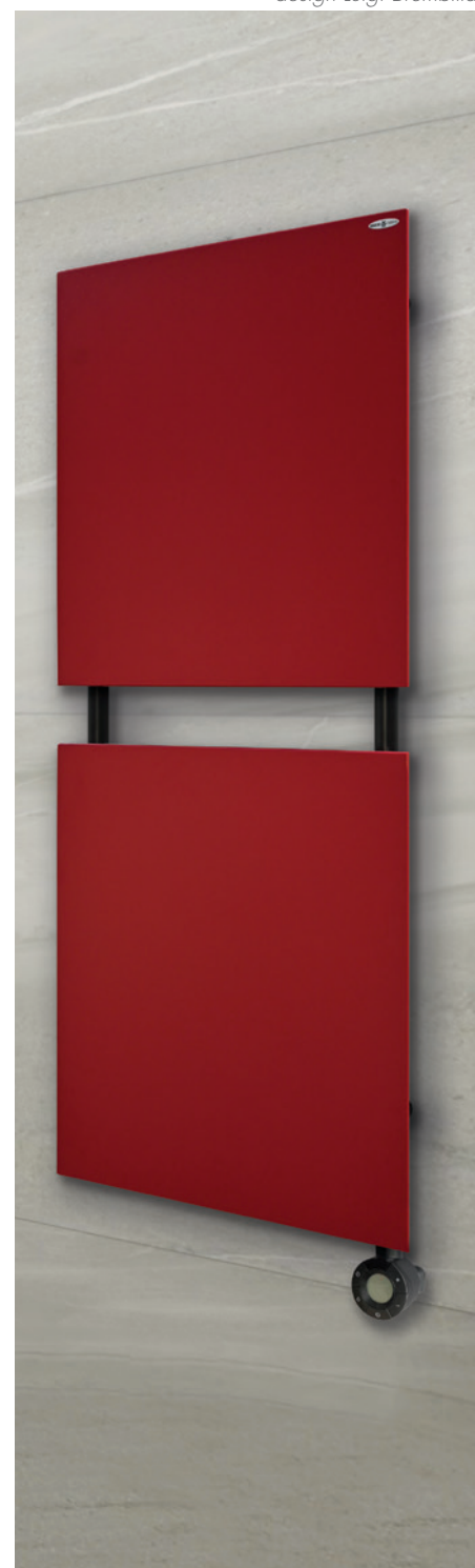
POSIZIONE RESISTENZA ☉ Resistenza verticale