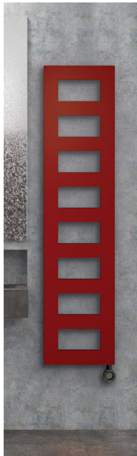
POSITION RESISTANCE ⊙ Résistance verticale