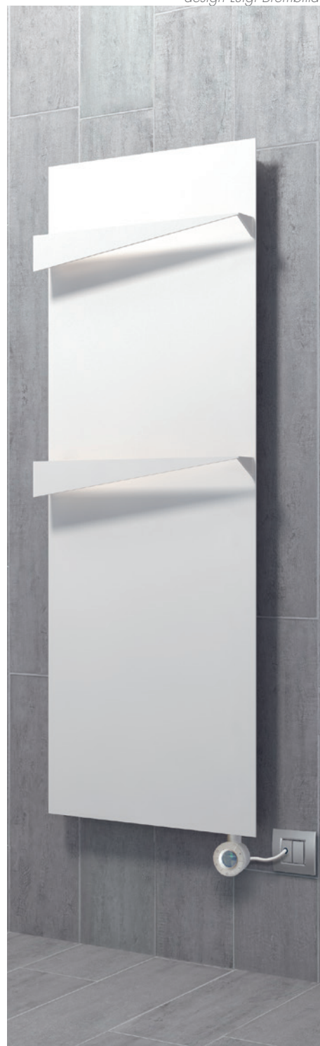
POSITION RESISTANCE © Résistance verticale