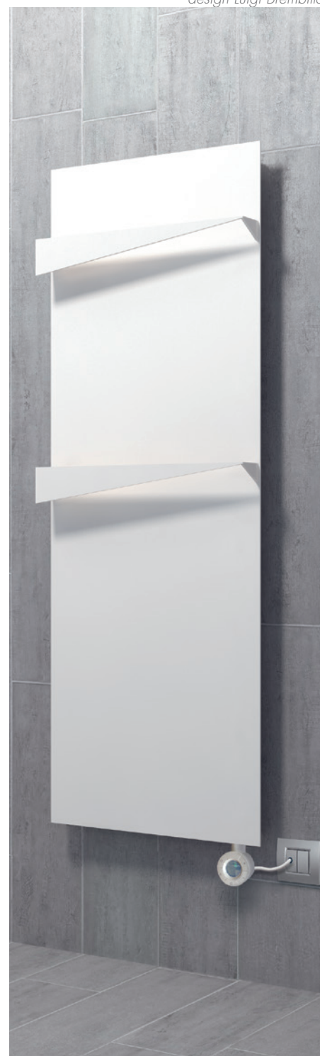
POSIZIONE RESISTENZA