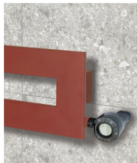
POSITION RESISTANCE Ⓢ Résistance horizontale Sur demande résistance en Ⓢ