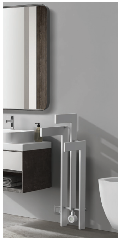
POSITION RESISTANCE ©Résistance verticale