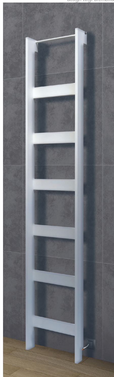
HERG-ÖT 212-50 ..58