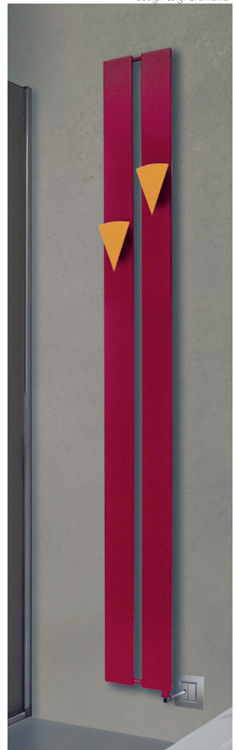
POSITION RESISTANCE © Résistance verticale