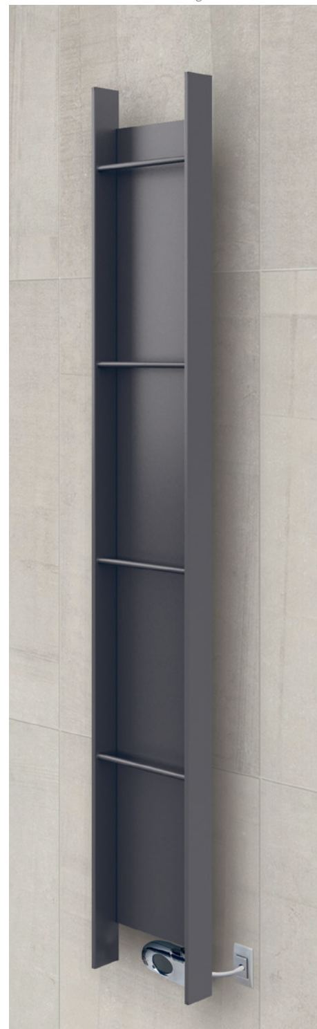
POSITION RESISTANCE © Résistance verticale