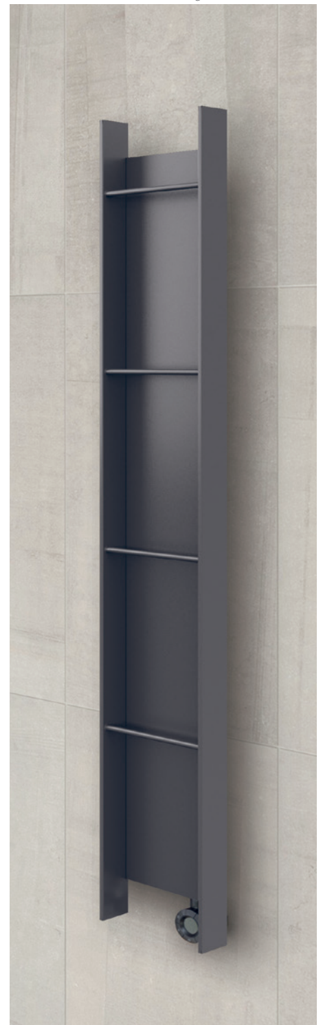
POSITION RESISTANCE © Résistance verticale