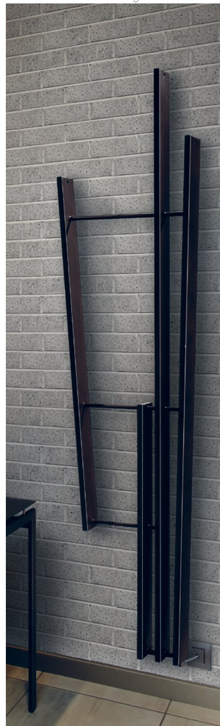
POSIZIONE RESISTENZA