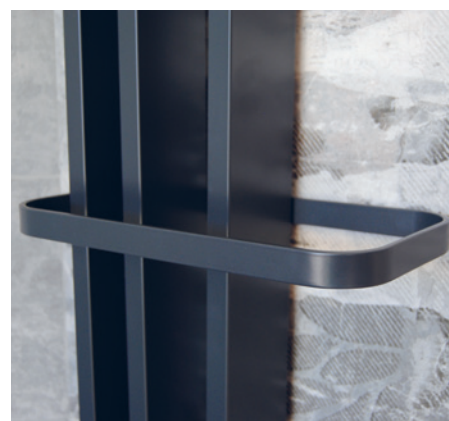
POSITION RESISTANCE ⊙ Résistance verticale

largeur avec barre 30 cm et 36 cm pour le modèle 210/5