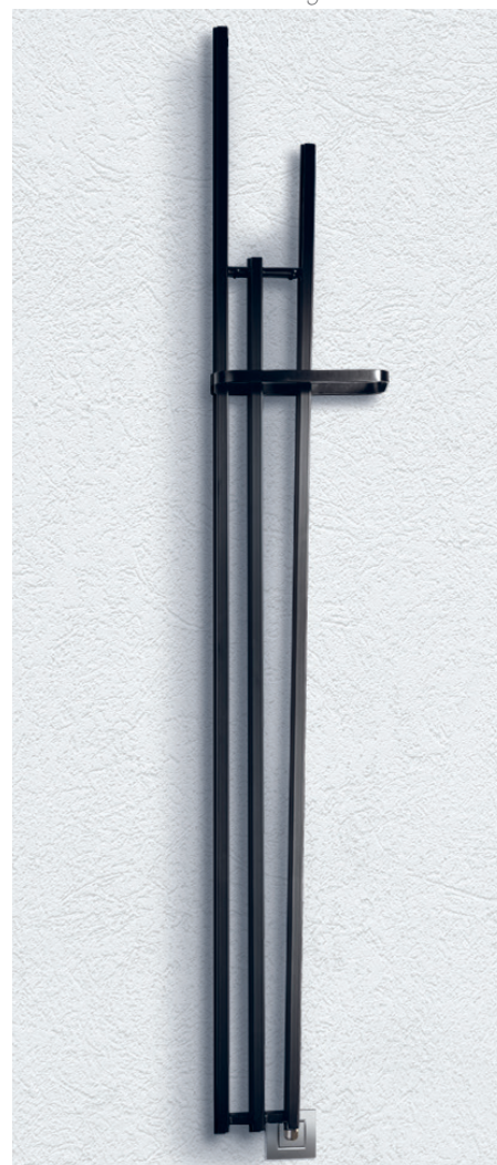
LAME Slim 210/5