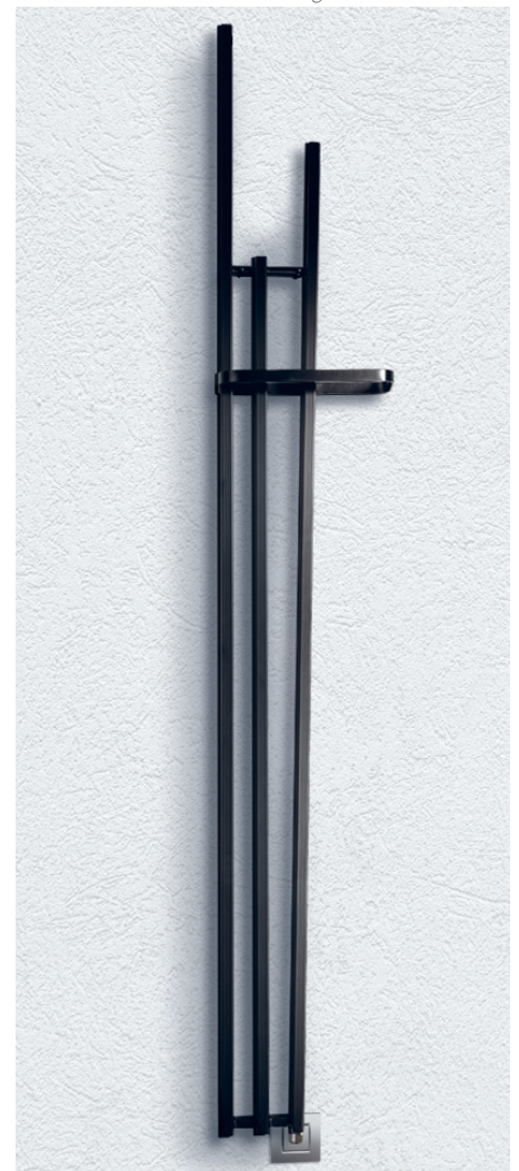
LAME Slim 210/5