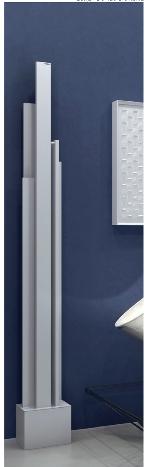
Sur demande, position sur le côté long Art.UPL