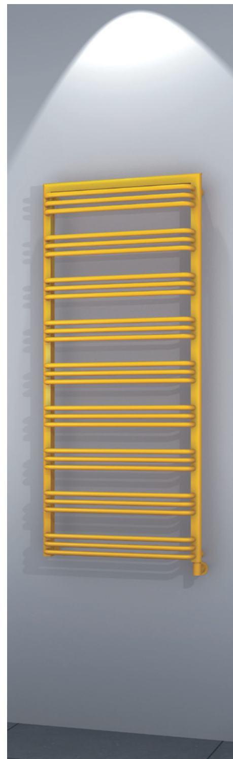
POSITION RESISTANCE