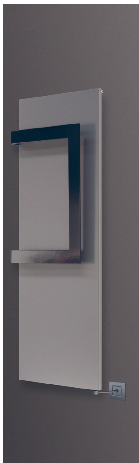
POSIZIONE RESISTENZA © Resistenza verticale