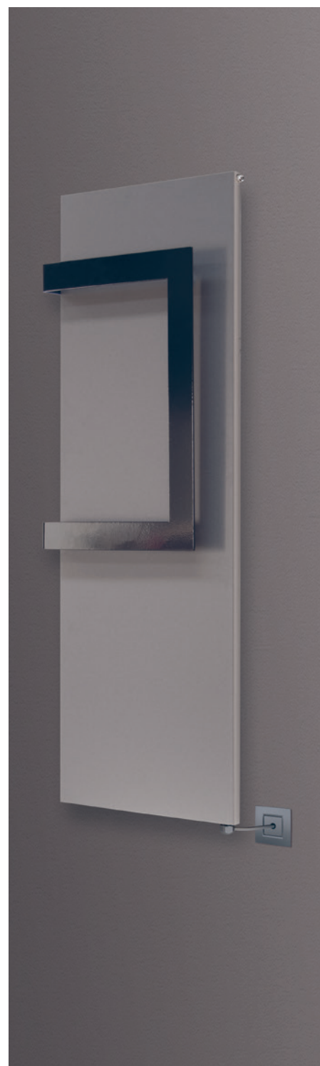
POSITION RESISTANCE ⊗ Résistance verticale