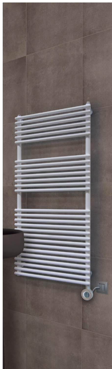
POSITION RESISTANCE ⊙ Résistance verticale