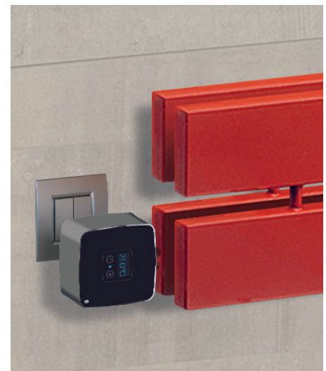
POSIZIONE RESISTENZA © Resistenza orizzontale