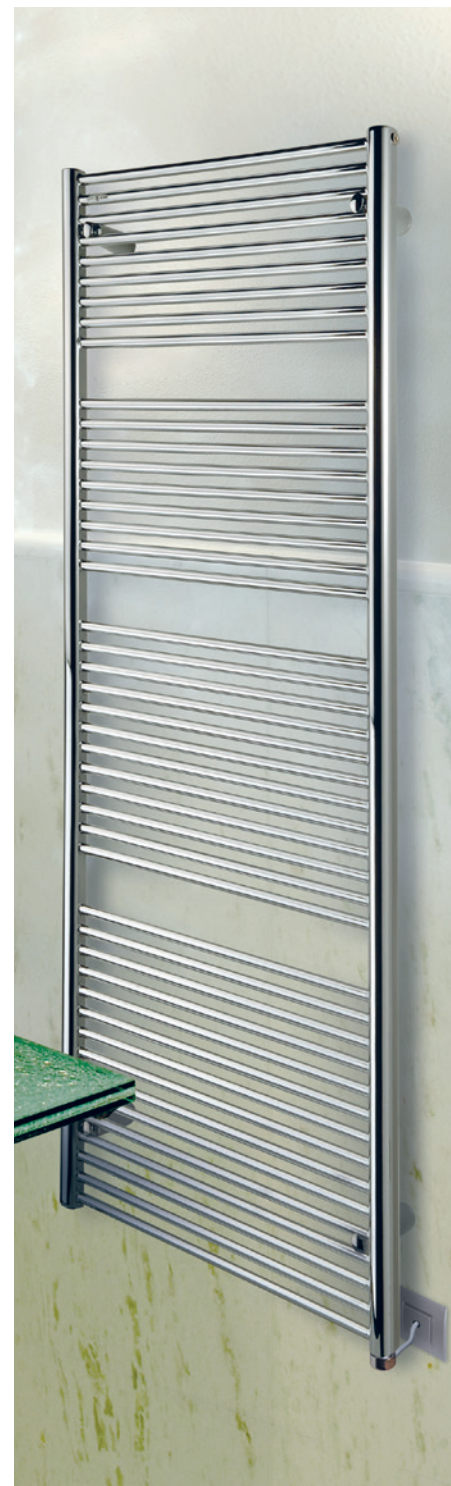
POSIZIONE RESISTENZA ☉ Resistenza verticale