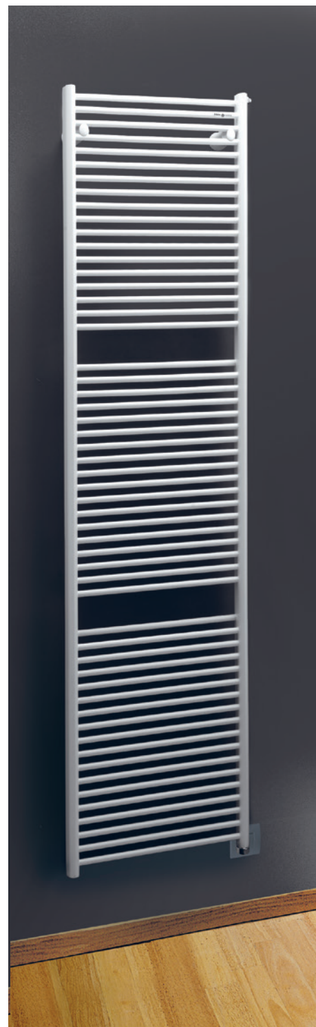
POSIZIONE RESISTENZA ☉ Resistenza verticale