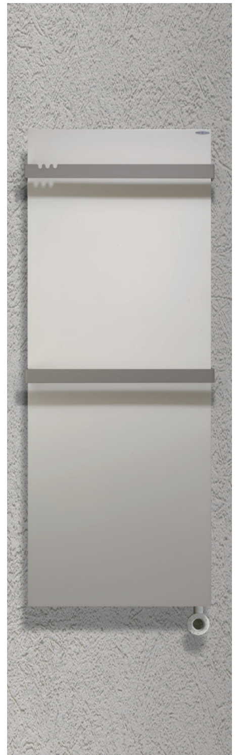
POSITION RESISTANCE ⊙ Résistance verticale